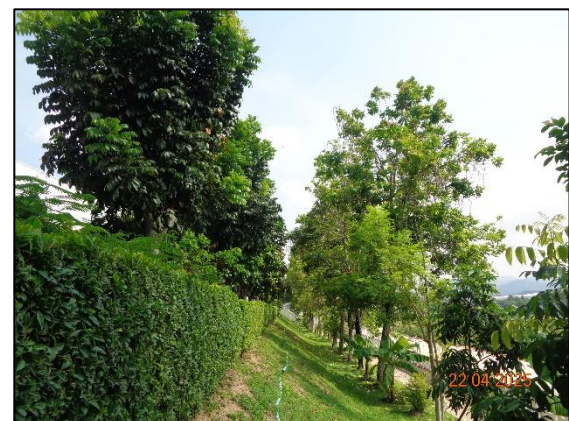
รูปที่ 2.31 พื้นที่สีเขียว