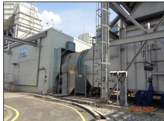
รูปที่ 2.14 Enclosure