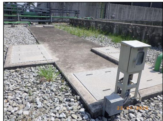
รูปที่ 2.6 ป่อแยกน้ำ-น้ำมัน