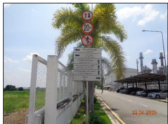
รูปที่ 2.16 ป้ายจราจรและป้ายจำกัดความเร็ว ภายในโครงการ