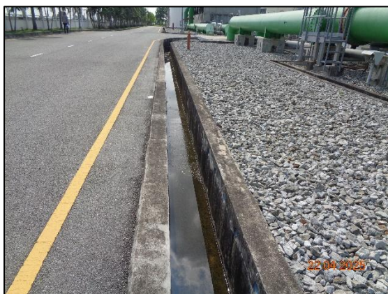
รูปที่ 2.5 รางระบายน้ำฝน