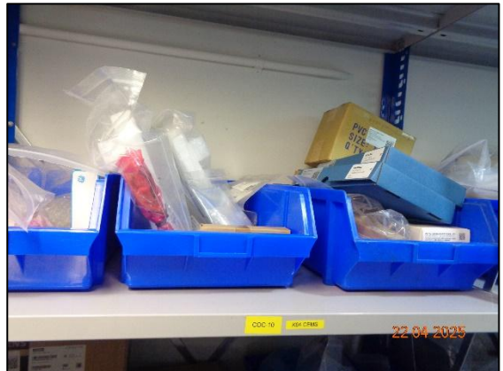
รูปที่ 2.4 อุปกรณ์สำรองระบบ CEMs