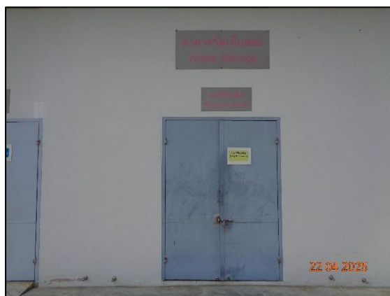
รูปที่ 2.19 พื้นที่จัดเก็บวัสดุรีไซเคิล