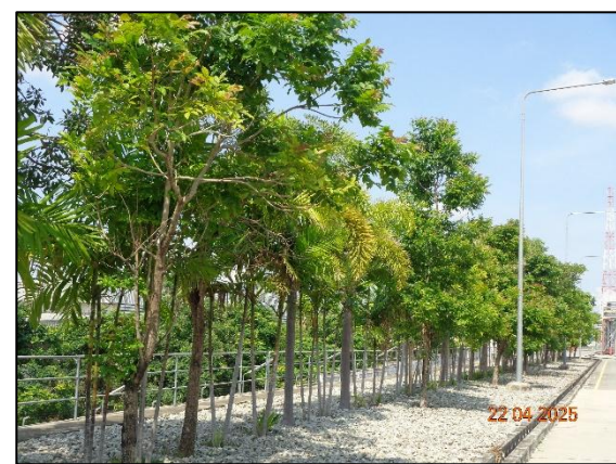
รูปที่ 2.31 พื้นที่สีเขียว (ต่อ)