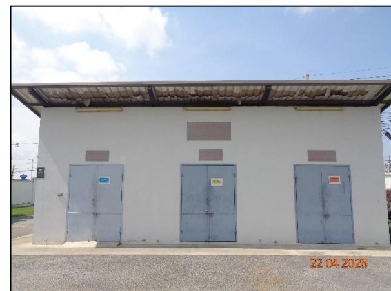
รูปที่ 2.20 อาคารจัดเก็บขยะ