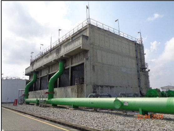
รูปที่ 2.1 ระบบหล่อเย็น