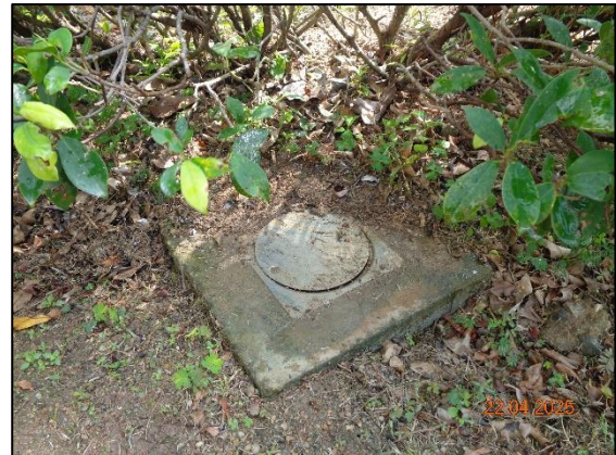
รูปที่ 2.8 ระบบบำบัดน้ำเสียสำเร็จรูป