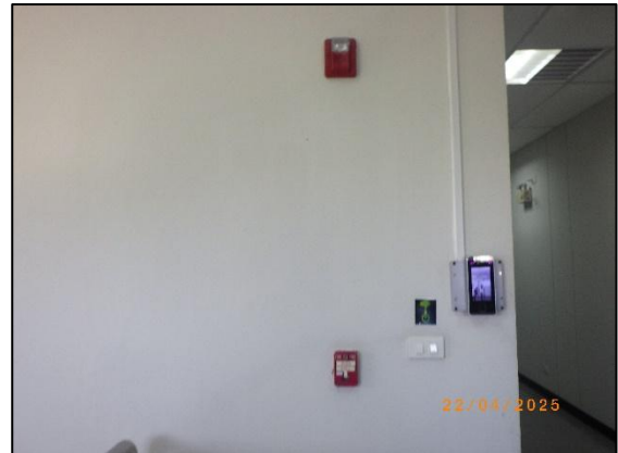
รูปที่ 2.27 สัญญาณเตือนภัย