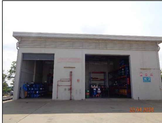
รูปที่ 2.23 อาคารจัดเก็บสารเคมี