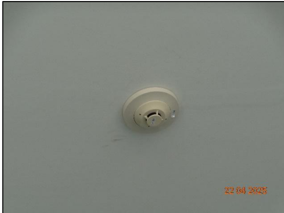
รูปที่ 2.26 ระบบตรวจจับควัน