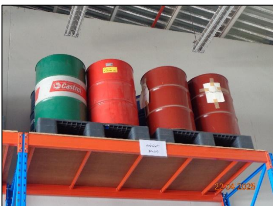
รูปที่ 2.21 ถังน้ำมันที่เสื่อมสภาพขนาด 200 ลิตร