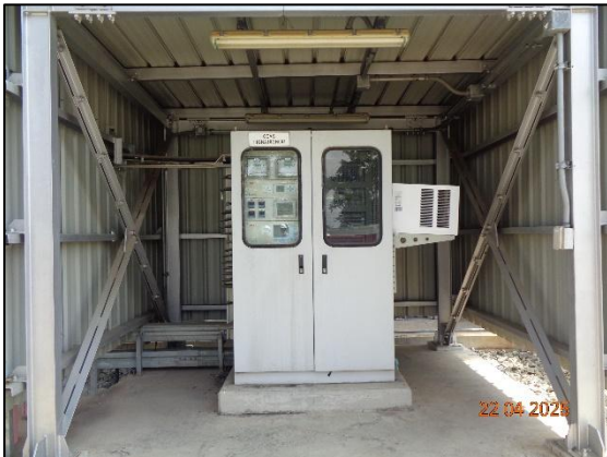
รูปที่ 2.3 ระบบ CEMs