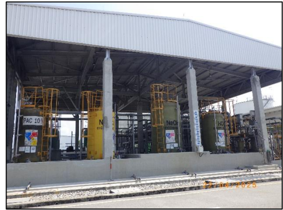
รูปที่ 2.24 พื้นที่ไหลดสารเคมี