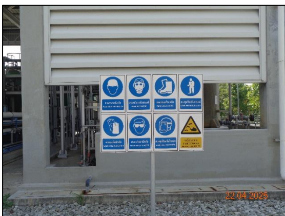
รูปที่ 2.10 ป้ายเตือนพนักงานสวมใส่ PPE