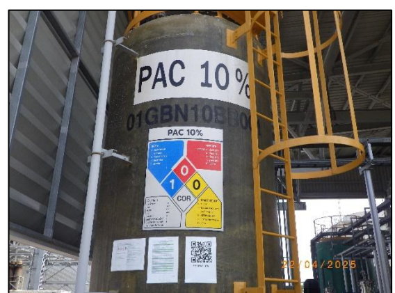
รูปที่ 2.25 ป้ายสารเคมี