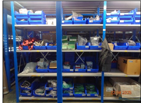
รูปที่ 2.12 ห้องเก็บอุปกรณ์ PPE