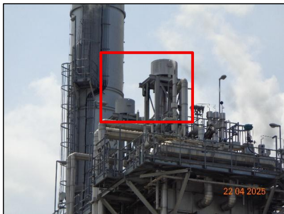
รูปที่ 2.13 Silencer