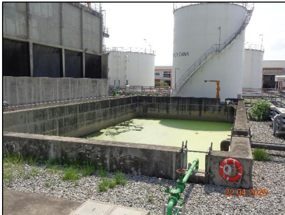
รูปที่ 2.7 บ่อพักน้ำทิ้ง