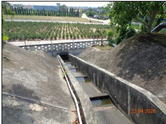
รูปที่ 2.17 จุดเชื่อมต่อระบบระบายน้ำฝน ของโครงการและนิคมฯ