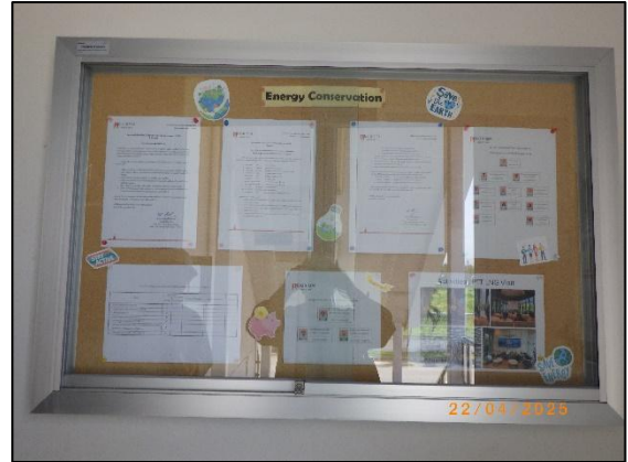
รูปที่ 2.30 บอร์ดประชาสัมพันธ์ข้อมูลข่าวสาร ด้านความปลอดภัย