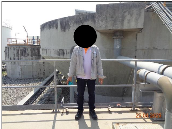
รูปที่ 2.11 พนักงานสวมใส่ PPE ขณะทำงาน