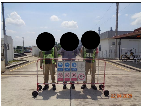
รูปที่ 2.15 เจ้าหน้าที่รักษาความปลอดภัย