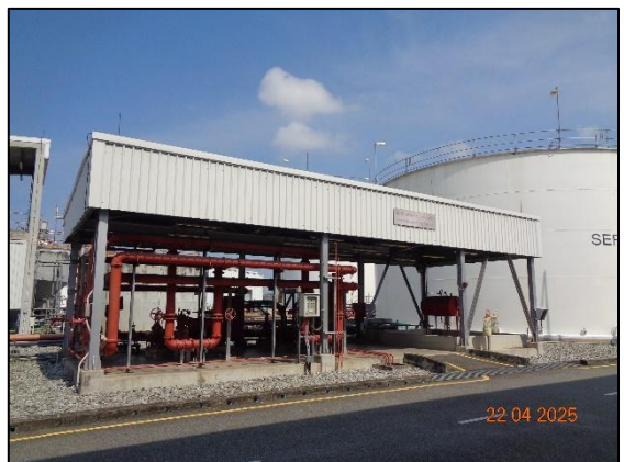
รูปที่ 2.28 อุปกรณ์ดับเพลิงภายในโครงการ