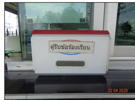
รูปที่ 2.22 ตู้รับเครื่องร้องเรียน