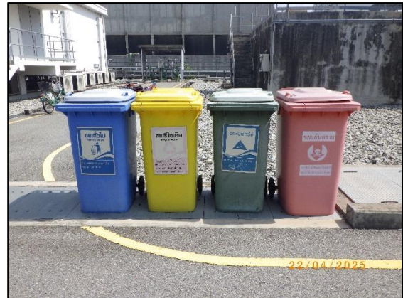
รูปที่ 2.18 ถังขยะแยกประเภท