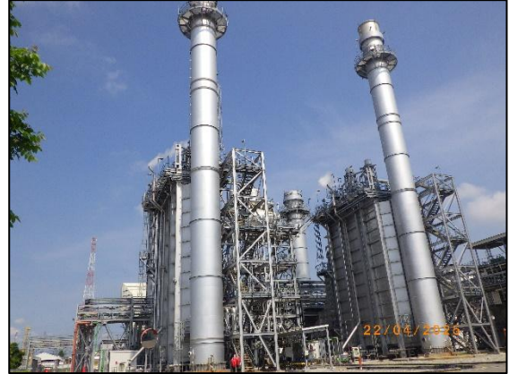
รูปที่ 2.2 ปล่อง HRSG 11 และ HRSG 12